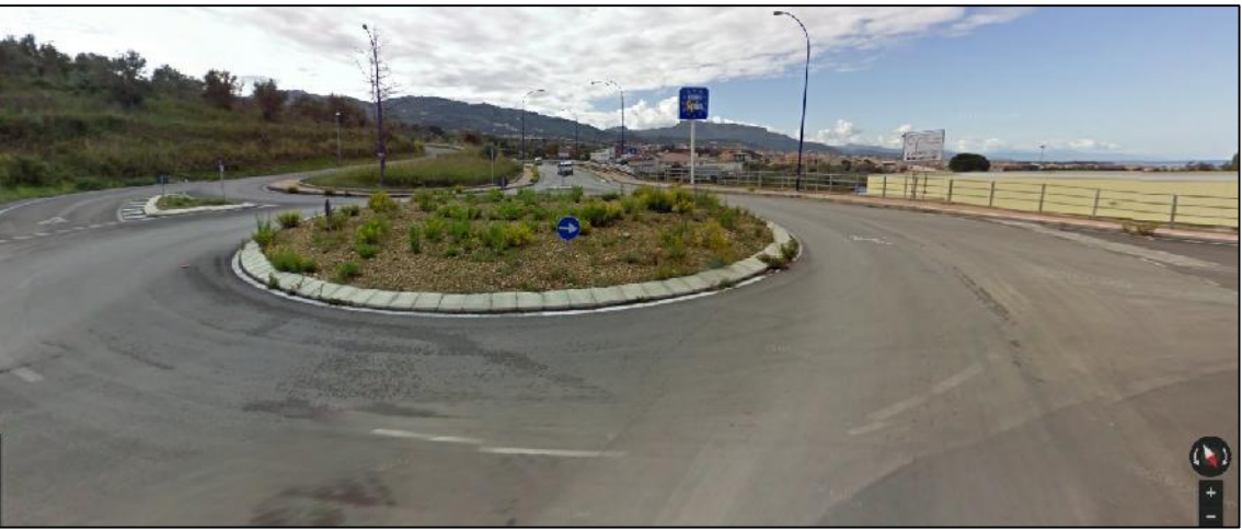
Foto stato di fatto