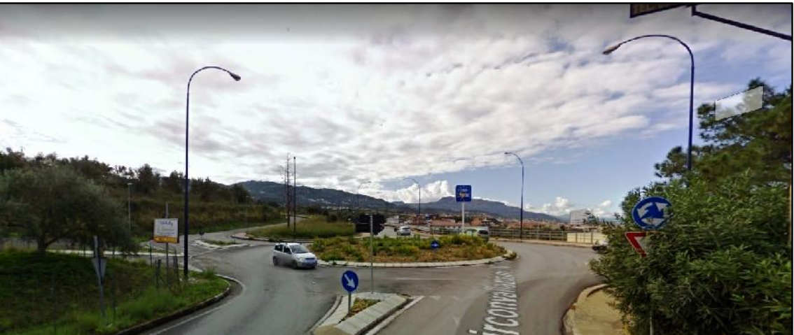
Foto stato di fatto