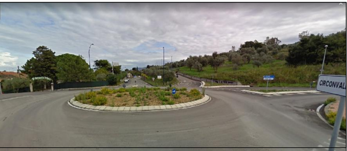
Foto stato di fatto