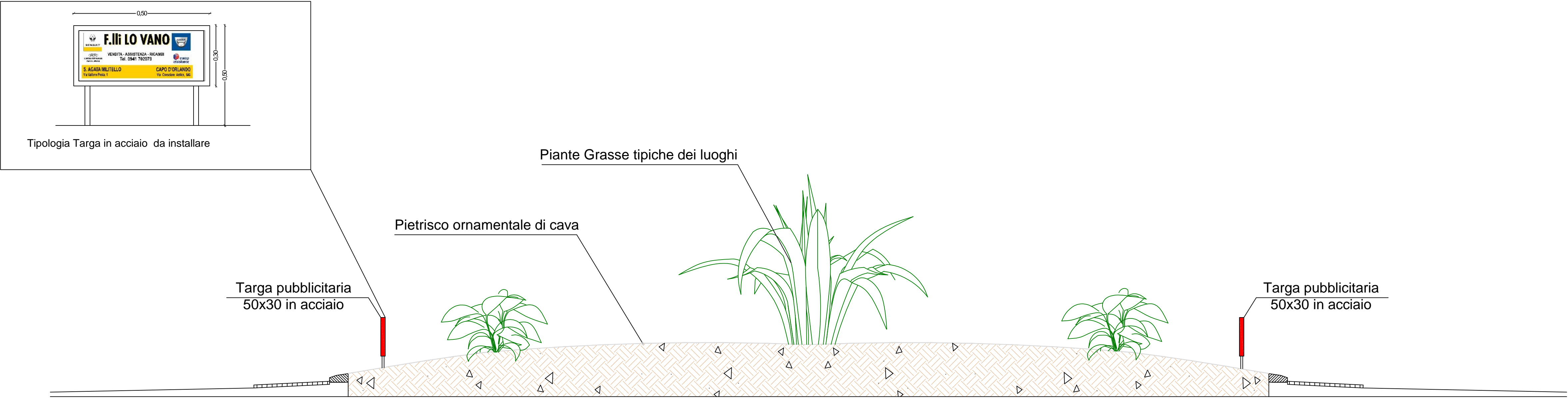
Sezione Rotatoria Scala 1:100